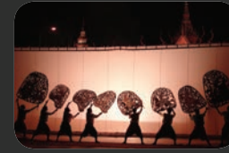
SPECTACLES SBEK THOM