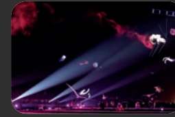
VOL DE NUIT FÉRIQUE