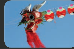
LE MONDE DES DRAGONS